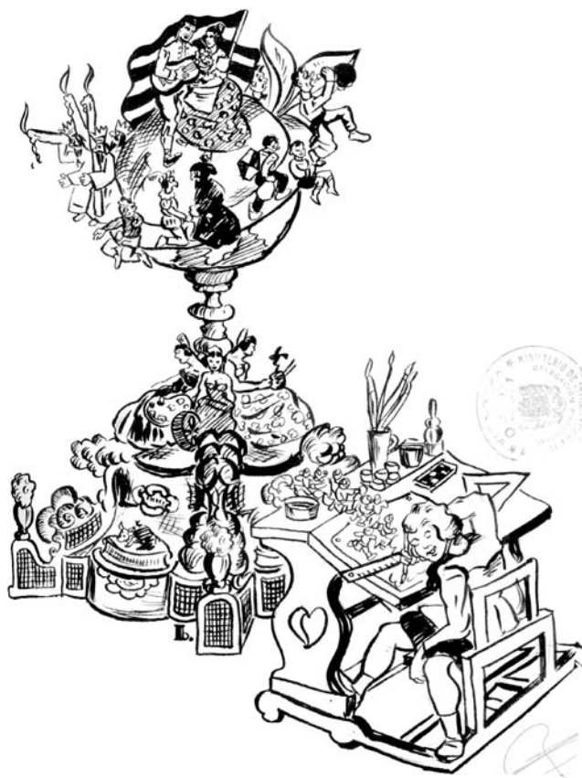
El somni d'un artista infantil, Convent de Jerusalem (1952).

Queda clar, que des de l'engegada corporativa, en el context de la defensa i millora de la professi3, es planteja la necessitat d'una formaci3 qualificadora per a capacitar nous artistes fallers i tamb3 els altres professionals especialitzats que es necessiten en la construcci3 del monument faller.