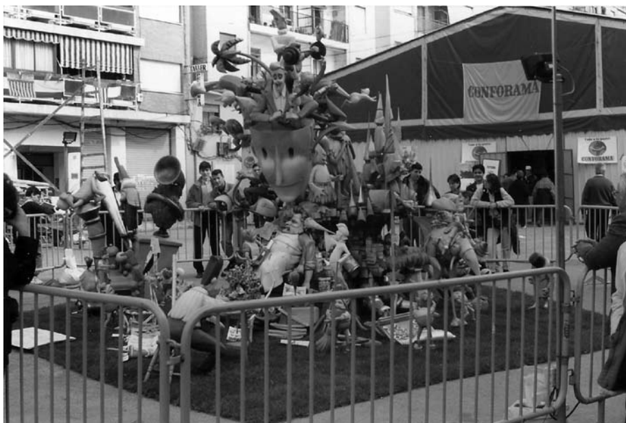
Si no fóra pels donyets , Josep Manuel Alares, L'Antiga de Campanar (1993).

Les diverses activitats del mateix col·lectiu d'artistes i la varietat d'encàrrecs a la qual els seus tallers fan front quant a esceno-