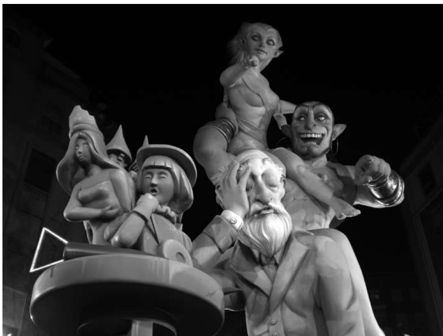
Malgeni i desgràcia, Javier Iguada, Sant Josep de la Muntanya-Terol (2009).

D'esta manera, el caràcter procedimental de la formaci3 permet adquirir els resultats d'aprenentatge, de manera que els estudi-